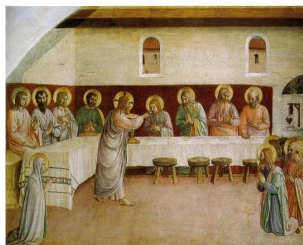
Comunione (particolare) / Beato Angelico Diventati credenti stavano insieme (Atti 2,44)