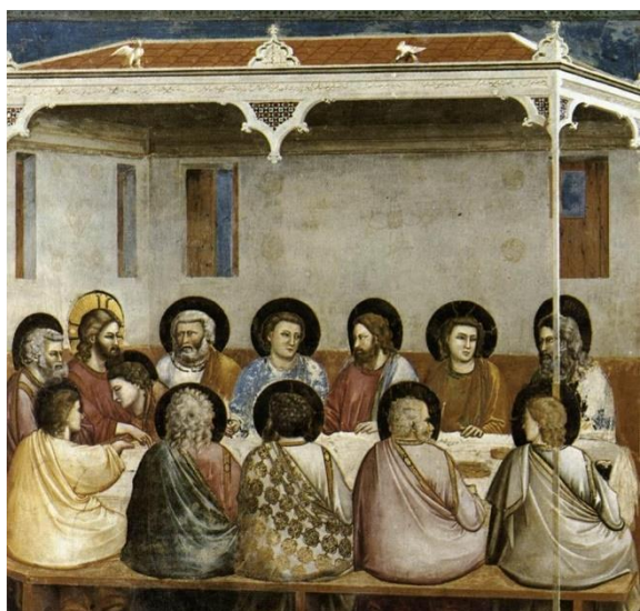
Giotto, Ultima Cena - 1303

Da questo tutti sapranno che siete miei discepoli: se avete amore gli uni per gli altri (Gv 13,35)