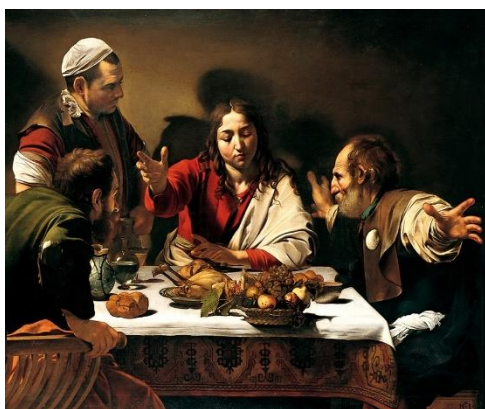
Caravaggio, Cena di Emmaus 1601

Il Consiglio Pastorale di Comunità pastorale (CPCP) e il Consiglio degli Affari Economici della Parrocchia (CAEP) si inseriscono nel percorso sinodale in atto nella Chiesa universale.